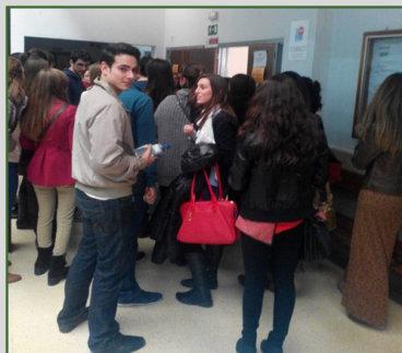
Aspirantes esperando a ser nombrados para entrar en la sala donde se desarrollará la prueba.

Como cada año se ha celebrado el día uno de febrero la examen para acceder a algunas de las especialidades de Enfermería