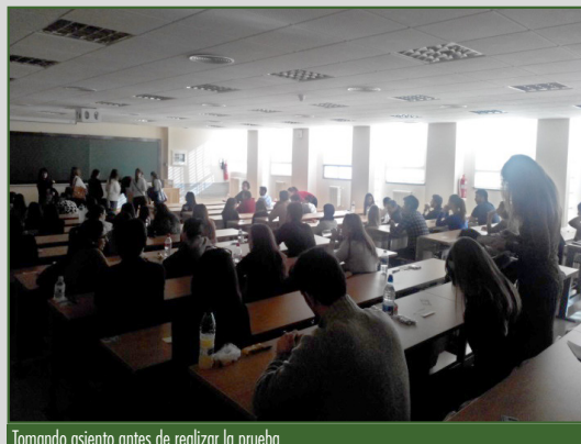
Tomando asiento antes de realizar la prueba.

se sepan las relaciones provisionales de asignaciones de plazas, en abril la asignación y finalmente en mayo la incorporación de los nuevos residentes.